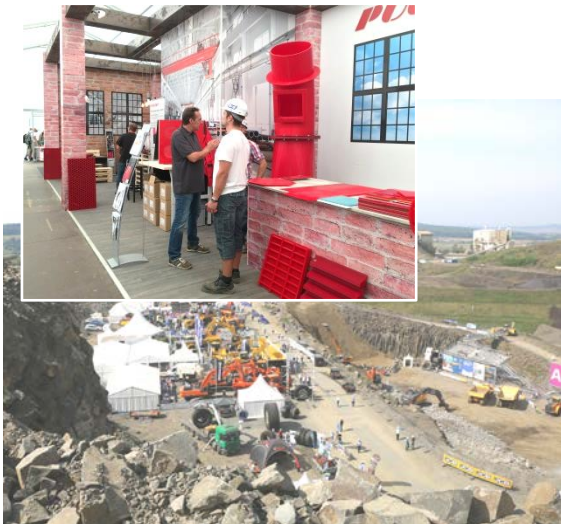
Bilder von der steinexpo Messe

PUCEST ® protect war im hessischen Homberg/Nieder-Ofleiden, im größten Basaltsteinbruch Europas, mit seinen neuesten Innovationen vertreten. Zu den Highlights gehörte sicherlich die PUCEST ® Vibrorinnenauskleidung. Mit ihr ist es gelungen einen Förderrinnenbelag mit „runden“ Ecken zu schaffen, der Maschinen langfristig vor Verschleiß und Defekten schützt und die Lärmemissionen reduziert. Die antihaft und selbstreinigenden Eigenschaften führen zu einem noch reibungsloseren Betrieb mit langen Standzeiten.