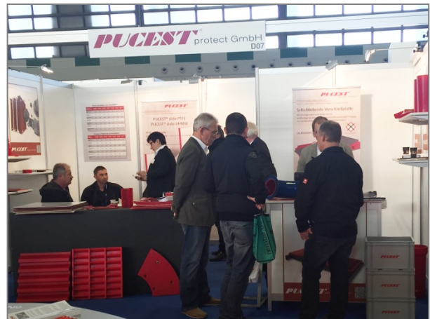
Impressionen vom PUCEST ® Messestand

Bei all unseren Besuchern möchten wir uns für das große Interesse und die positive Resonanz bedanken. Es waren viele interessante Gespräche mit Ihnen. Wir würden uns freuen Sie auf der bauma 2016 auf unserem Messestand in Halle C1, Standnummer 449 , wieder begrüßen zu dürfen.